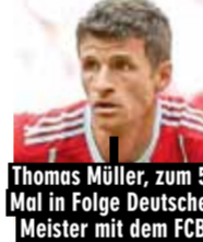
Thomas Müller, zum 5. Mal in Folge Deutscher Meister mit dem FC Bayern

Die gesamte Saison als XXL-Spielplanposter Mitte August startet die Fußball-Bundesliga in die neue Saison, aber bereits am 28.07. geht es für die 2. Liga los. Der zuverlässige Begleiter durch die Saison ist wieder das 246-seitige Bundesliga-Sonderheft von SPORT BILD: Mind. 7 Seiten ausführliche Infos zu jeder Bundesliga-Mannschaft und eine Doppelseite für alle Zweitligisten. Dazu gibt es jede Menge News zur 3. Liga sowie der Frauen-Bundesliga. Das Bundesliga-Sonderheft wird rechtzeitig zum Start der 2. Liga im Einzelhandel erscheinen. Achten Sie auf unsere weiteren Informationen.