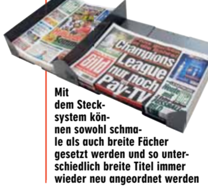
Mit dem Stecksystem können sowohl schmale als auch breite Fächer gesetzt werden und so unterschiedlich breite Titel immer wieder neu angeordnet werden

Richten Sie Ihre Bestellung nur per Mail an: pos-management@salesimpact.de